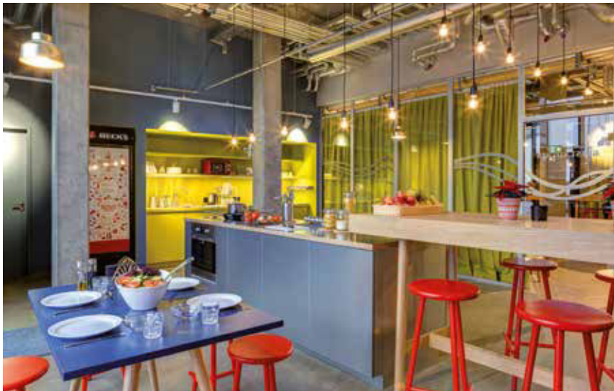
Die Gästeküche im Meininger Berlin East Side Gallery ist zentraler Treffpunkt, Küche und Esszimmer in einem.