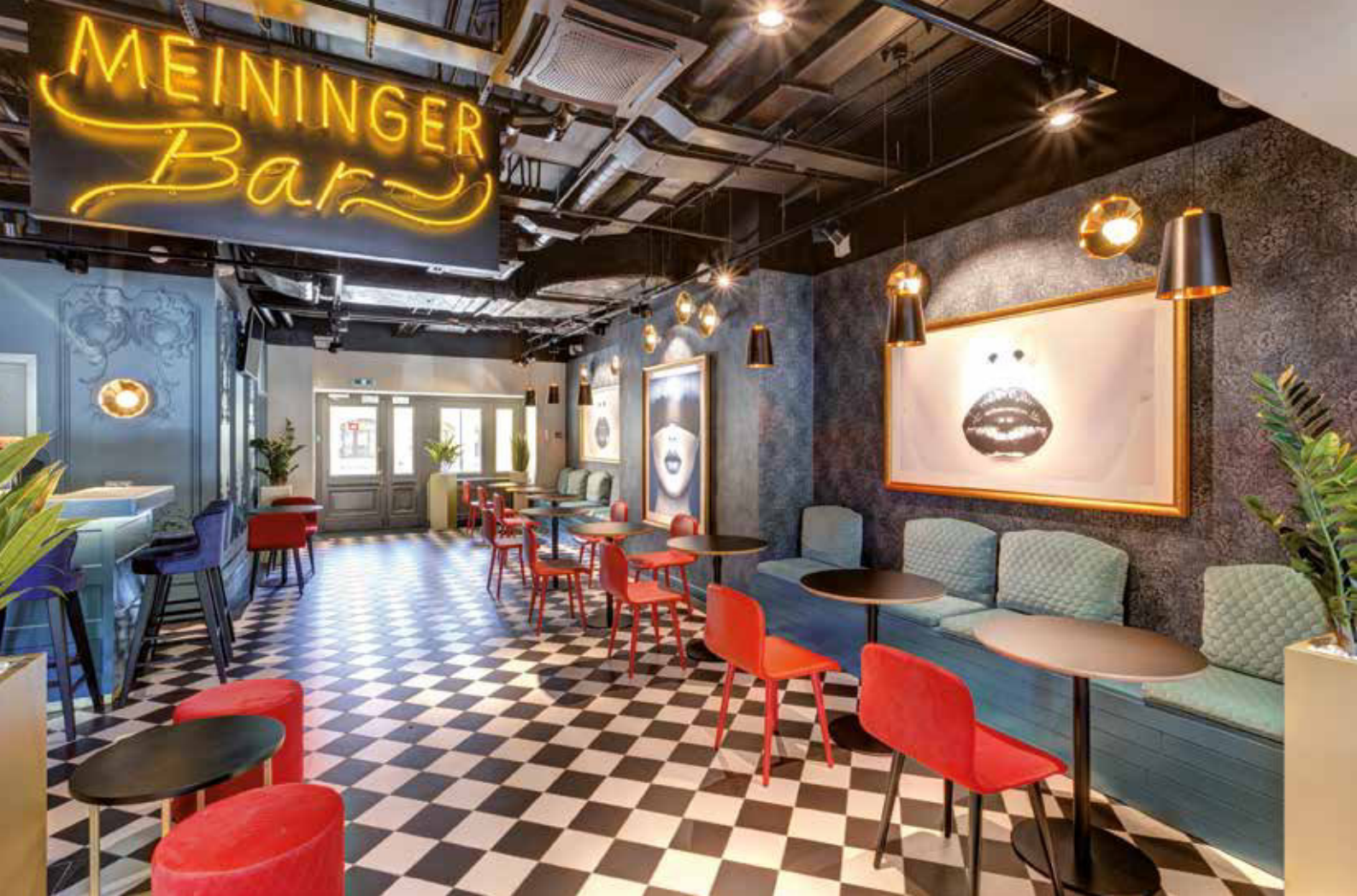
Treffen, trinken, tratschen in der Meininger Bar. Hier das Haus in St. Petersburg.