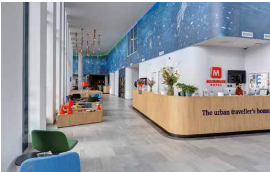
Der „urban traveller“ bevorzugt große Metropolen, deshalb befinden sich die Meininger-Hotels in zentraler Lage, wie hier in Amsterdam.